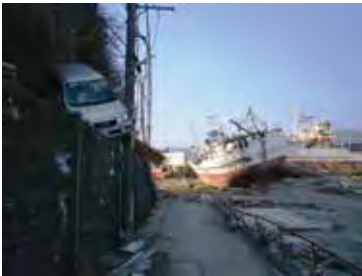
リアス・アーク美術館所蔵