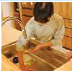
小学6年生の次女も使い慣れた様子

バイオマスエネルギー活用施設の話聞き、ディスポーザは便利だけでなく、 環境にも良いし、使っているだけでSDGsに貢献 できるなんて、得なことしかありません。ぜひ皆さんにも取り入れてほしいです。