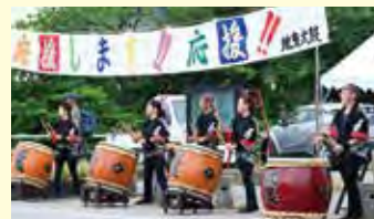
コース上での応援