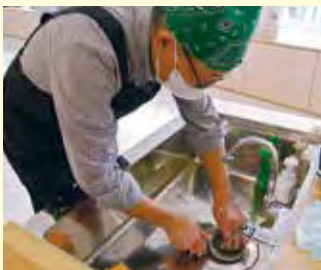
「あおーよ」で開催された「男の料理教室」。初めての方でもカンタン!

10月にオープンしたばかりの市民交流センター「あおーよ」調理室には、なんと5基のディスポーザが設置されています。